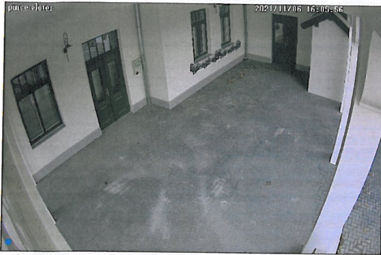
Földszinti lift pihenő